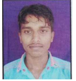
Photo & Specimen Signature of the Candidate