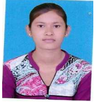
Photo & Specimen Signature of the Candidate